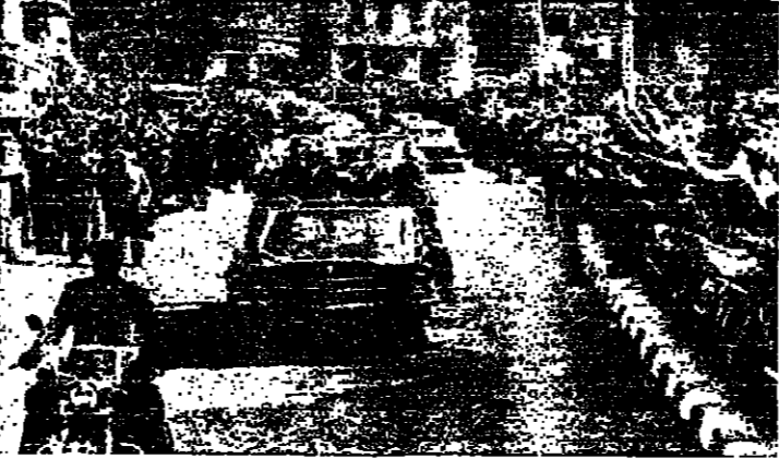
الرئيس السادات في مسيرته بكنيسة باحد شوارع القاهرة

امس الاول ان السلطات صارت وثائق منظمات باركسية اجنبية ضد الحلي على الثورة ضد الحكومة نيت ان منظمات باركسية اجنبية ضد الحلي على الثورة ضد الحكومة نيت ان منظمات باركسية اجنبية ضد الحلي على الثورة ضد الحكومة